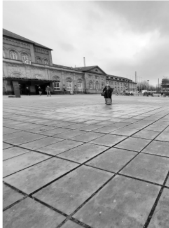
Versiegelte Flächen, nackter Stein, Beton und Stahl. Das geht auch anders!

Bebauungspläne und ggf. ergänzende städtebauliche Verträge, sollten in Zukunft größtmögliche Anforderungen an Klimaschutz, Ressourcenminimierung und Flächenverbrauchsreduzierung festschreiben. Darüber hinaus sind immer auch Klimaanpassungsmaßnahmen und die Förderung stadt-