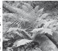
Farn und Totholz in einem Erdfall.

rasen und Felsbiotope bilden ein abwechslungsreiches Mosaik. Auf den besonders artenreichen Magerrasen sind als floristische Highlights z.B. Frühlings-Adonisröschen und Berg-Gamander zu finden. Zahlreiche Fledermausarten finden