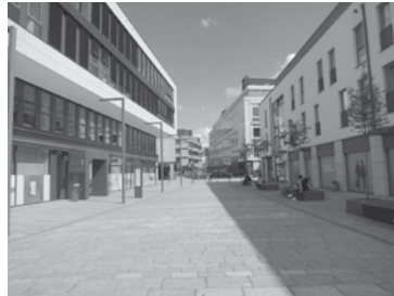
Stein, Beton und Stahl heizen sich im Sommer stark auf. Hier fehlt Begrünung.