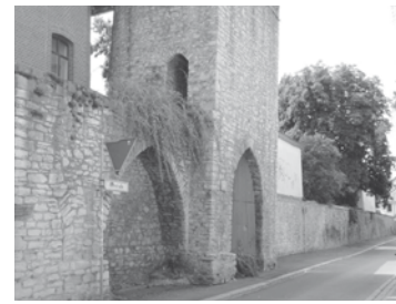
Auch historische Gebäude(-elemente) können grün aufgewertet werden.