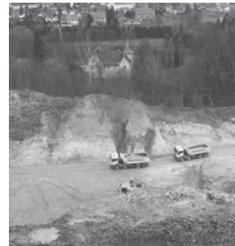
Röseberg West 2012.

Der oberirdische Gipsabbau mit schwerem Gerät hat schon viele wertvolle Fels- und Magerrasenbiotope zerstört. Und gerade jetzt, versucht die Gipsindustrie neue Abbaugenehmigungen zu erhalten!