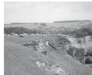
Dohlenklippen Bartolfelde.

Für die Offenhaltung des wertvollen Grünlandes ist die Weidetierhaltung, etwa mit dem Harzer Roten Höhenvieh, unerlässlich. Allerdings plagen die Weidetierhalter Existenzsorgen, da die Weidetierprämie derzeit auf den mageren Mittelgebirgsstandorten viel zu gering ist. Doch es gibt ein wenig Hoffnung: Der Landschaftspflegeverband erarbeitet derzeit einen Antrag für ein Naturschutzgroßprojekt, dass insbesondere den Erhalt der wertvollen Offenlandschaftslebensräume als Ziel hat.