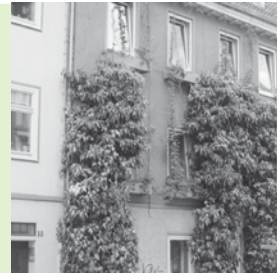
Schon eine teilweise Begrünung bringt allerlei positive Effekte.